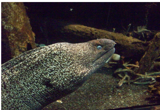
Murène sur le qui-vive