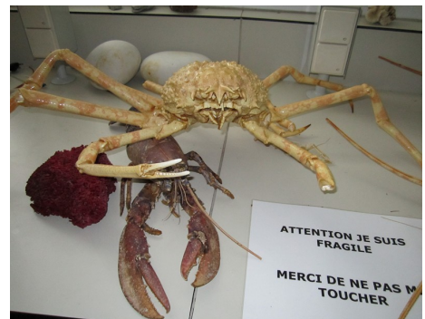
Un lien de parenté ?

Ils sont ensuite allés manger sur la plage après avoir participé à une «chasse aux trésors» sur la plage afin de trouver les œufs de roussettes et de raies.