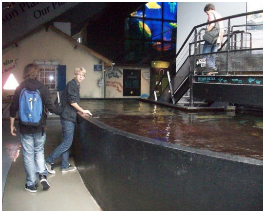
Le plaisir de caresser les raies