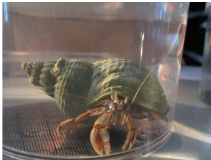
Un milieu peu habituel !