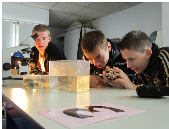
Observations dans la bonne humeur

Ils sont partis du lycées vers 6h45 et sont arrivés vers 9h. Juste à temps d'ailleurs pour une mini conférence sur la biodiversité qui avait pour but de leur faire découvrir différentes espèces présentes dans les mers et océans de notre planète. Ils ont ensuite réalisé des expériences dans le laboratoire du centre où ils ont pu observer d'un peu plus près nos petits amis marins avec un microscope. Ils devaient établir la parenté entre les espèces.