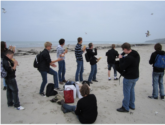
Pique-nique sur la plage