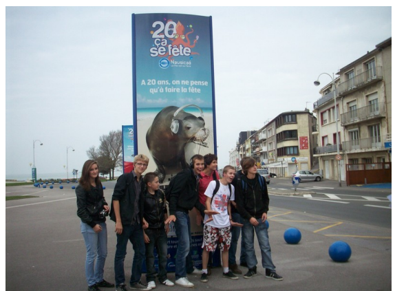
Des « spécimens » bien sympathiques !