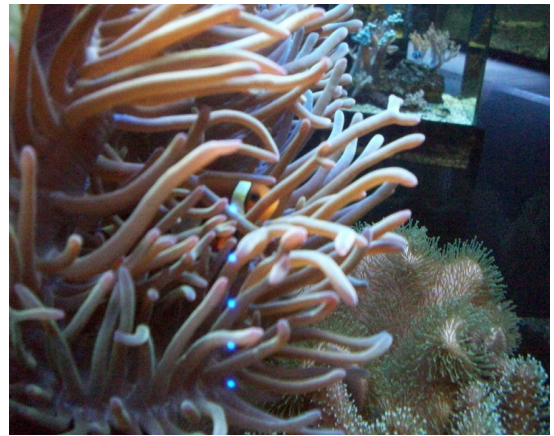
Némo se cache