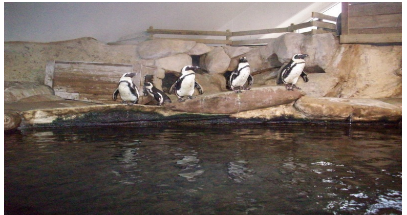
Les manchots qui nous ont beaucoup amusés