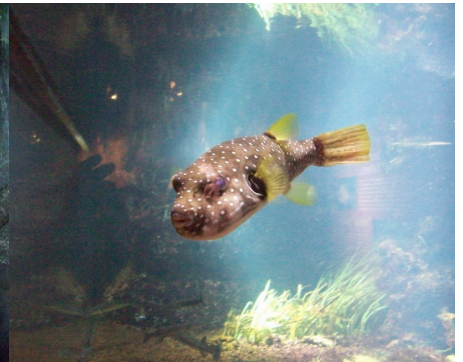
Drôle de bête