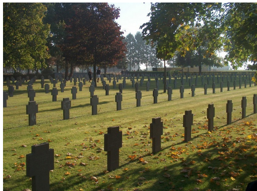
Le cimetière allemand de Cerny en Laonnois

Les élèves de 3e des lycées Robert Schuman et du Val de Serre, se sont rendus sur le Chemin des Dames le 29 septembre. Une fois sur place ils ont réalisé un parcours en vélo afin de découvrir les principaux sites.