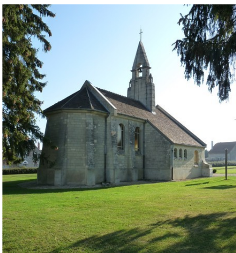
Chapelle-mémorial de Cerny-en-Laonnois