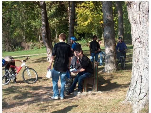
Une petite pause s'impose après les côtes