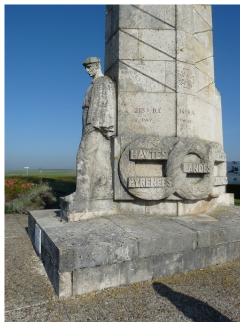
Le monument des basques