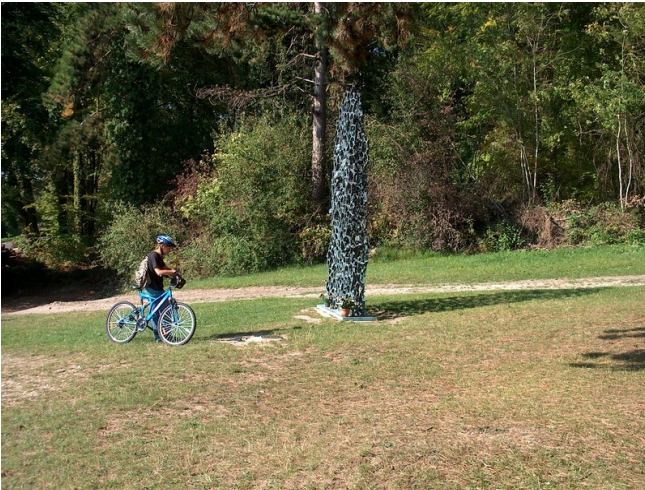
Sculpture- monument édifié à la mémoire des soldats du 18e R.I "Ils n'ont pas choisi leur sépulture" réalisé par Haim Kerner