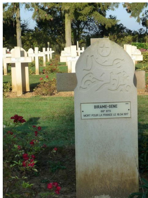
Des stèles de religions différentes