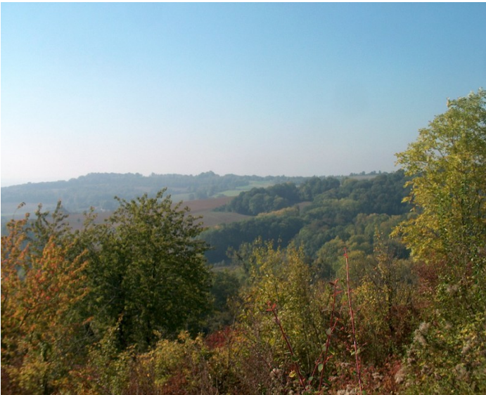
Panorama depuis le Plateau de Californie