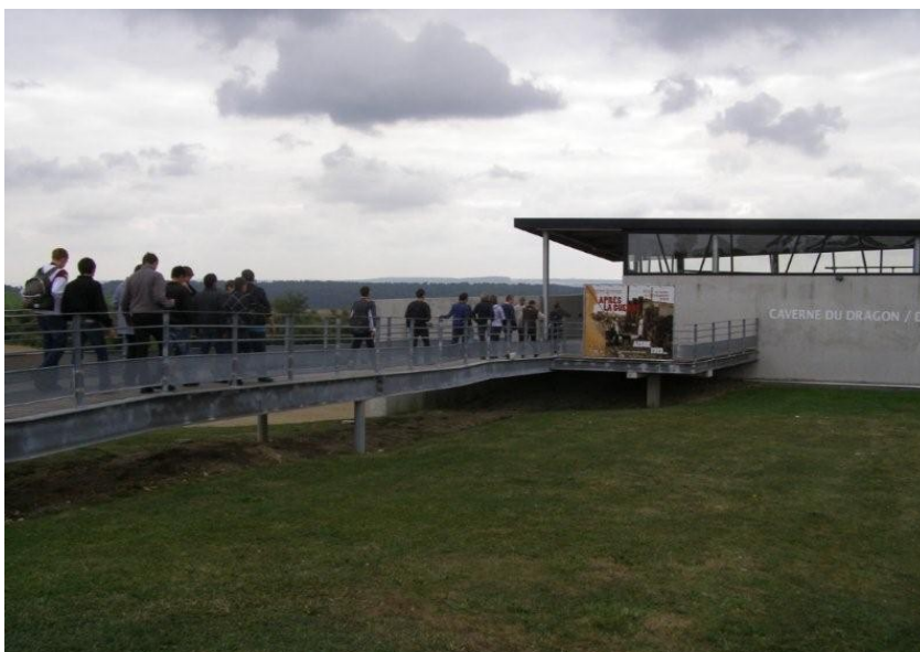
Visite de la Caverne du Dragon pour mieux comprendre les conditions de vie des poilus sur ce champs de bataille