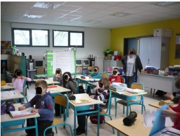
Les enfants de la classe de CE2